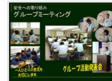
グループミーティングの様子

また、道路を大切な職場と捉え、地域の清掃活動を定期的実施しており、洗車や職場清掃なども含めて効率的に行えるよう、清掃道具や工具の管理を徹底している。5S(整理・整頓・清掃・清潔・躰)を徹底することで、感謝の念や安全作業を生み出すという経営理念があり、安全・エコドライブの基礎となっている。