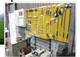
整理整頓された工具