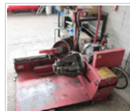
タイヤチェンジャー

エコドライブにとって重要なタイヤに対する理解を深めるため、社内にてタイヤチェンジャーの使用者認定を行っており、使用許可を持つドライバーが積極的に教育をしている。結果としてドライバーがタイヤの空気圧や状態を積極的に意識する風土が社内に根付いている。