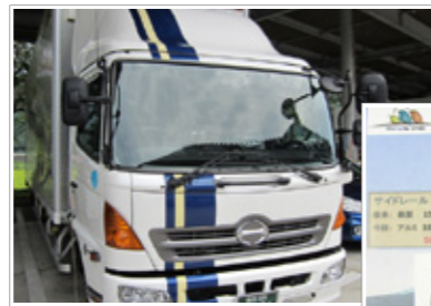
軽量化された車両

他にも蓄冷式クーラーやエコタイヤなども積極的に導入し、効果を検証しながらドライバーのエコドライブを支援している。